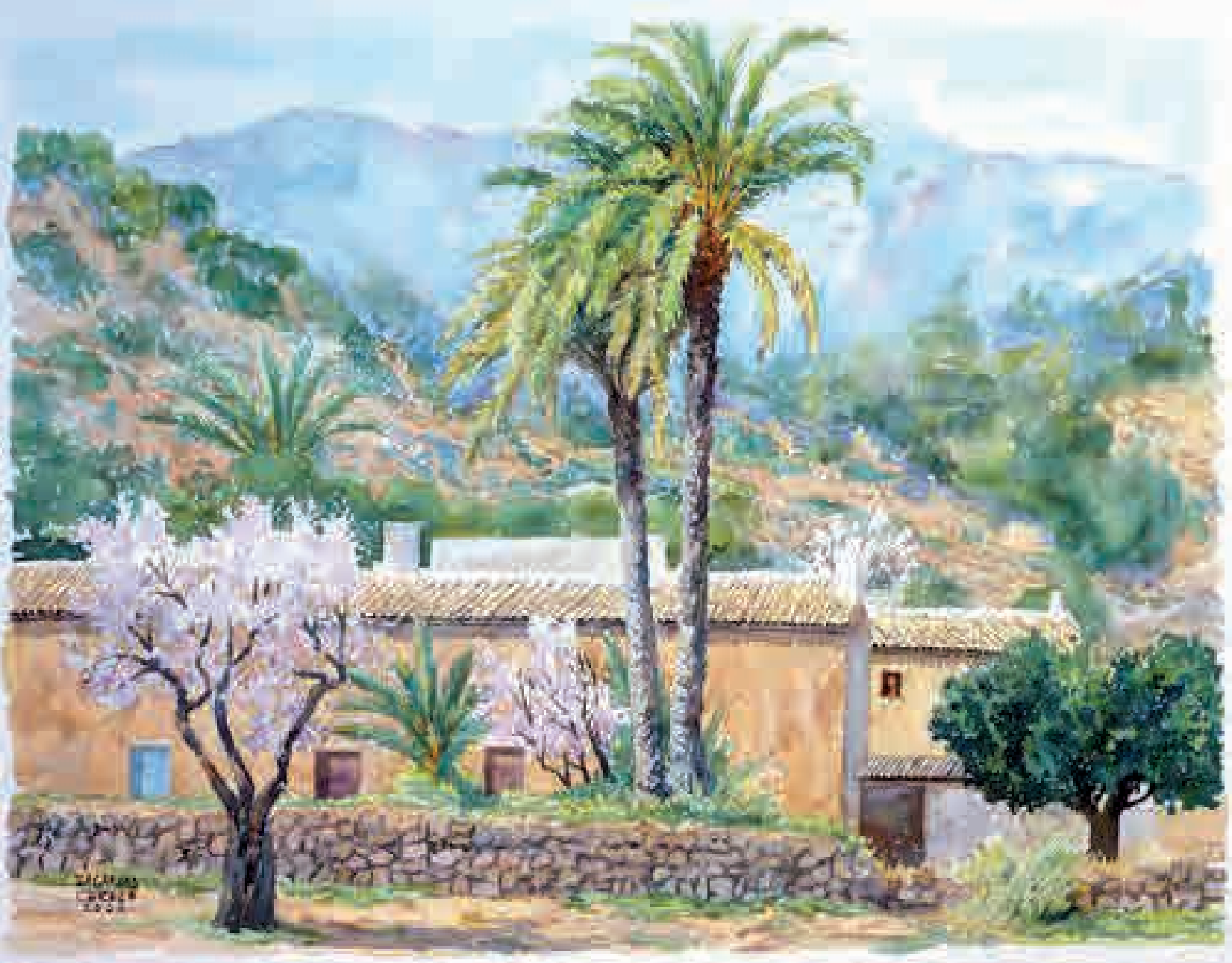
FUENTE BLANCA - FORTUNA - MURCIA