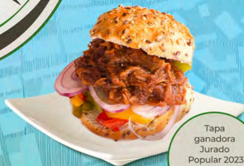
Tapa ganadora Jurado Popular 2023 Jackaroo Australian Bar