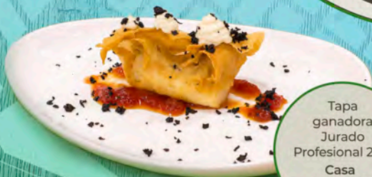
Tapa ganadora Jurado Profesional 2023 Casa Fulgencio